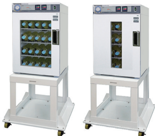
専用台TRA-525 (別売) に固定した状態